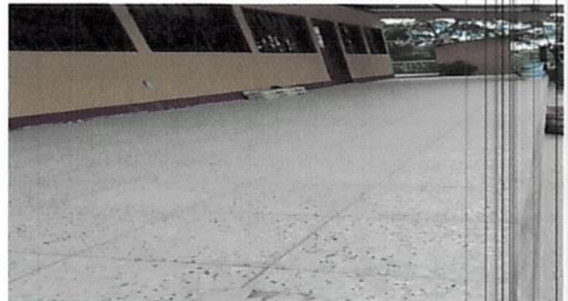
Foto 6: Colocación de piso granito en el corredor del establecimiento.

Observación: Si es necesario se pueden agregar hojas adicionales y actualizar el número de hojas.