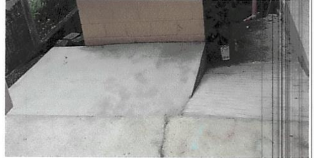
Foto 2: Reconstrucción de torta de concreto 10 cms de espesor en patio del establecimiento.